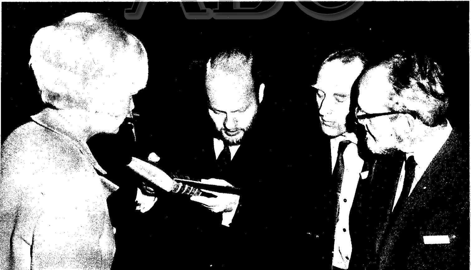
Encuadernadores centro-europeos examinando una encuadernación artística en la visita efectuada a la Biblioteca del Palacio Real de Estambul.